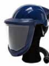
Art.-Nr.: 625H065012 SR580 Schutzhelm hochklappbares Visier, PC - Sichtscheibe, mit verstellb. Kopfband Standardvorrichtung für Gehörschutz