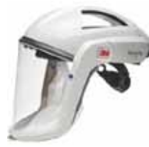
Art.-Nr.: 625M106 Visierkopfteil M106 Gesichtsabdeckung aus PU - beschichtetem Polyamid, leicht, kratzfeste Beschichtung