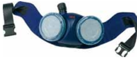
Art.-Nr.: 6250850010 JUPITER Gebläse Batteriebetriebenes Gebläse, auszustatten mit Partikel- oder Kombinationsfilter