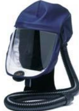
Art.-Nr.: 625H060312 SR520 Haube schlag- und chemikalienbeständige Scheibe, mit verstellb. Kopfband