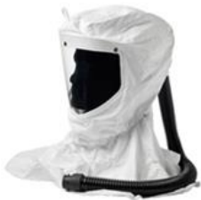
Art.-Nr.: 625H065012 SR561 Haube Ersetzbare Leichtgewichtshaube aus Tyvec, leicht, verstellb. Kopfteil, schützt Kopf und Schultern