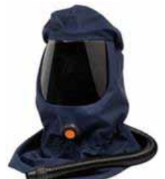
Art.-Nr.: 625H060412 SR530 Haube schlag- und chemikalienbeständige Scheibe, mit verstellb. Kopfband, schützt Kopf und Schultern