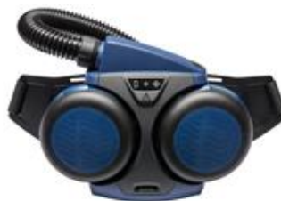
Art.-Nr.: 625H06012 SR500 Gebläse Batteriebetriebenes Gebläse, auszustatten mit Partikel- oder Kombifilter