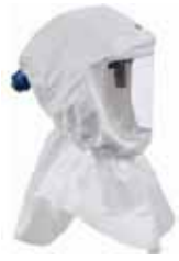
Art.-Nr.: 625S655 Haube Premium S655 Mit Hals- und Schulterabdeckung