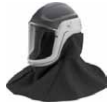
Art.-Nr.: 625M407 Helmkopfteil M407 Cape mit Hals- und Schulterschutz, hitzebeständig, kratzfeste Beschichtung