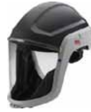
Art.-Nr.: 625M306 Helmkopfteil M306 Gesichtsabdeckung aus PU - beschichtetem Polyamid, leicht, kratzfeste Beschichtung