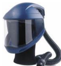
Art.-Nr.: 625H060512 SR540 Schirm hochklappbares Visier, PC - Sichtscheibe, mit verstellb. Kopfband