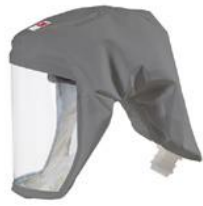
Art.-Nr.: 625S655 Einweggleichthaube S333G Sehr gute Luftverteilung, geprüft, robust, weich, knitterfest, geräuschminimiert